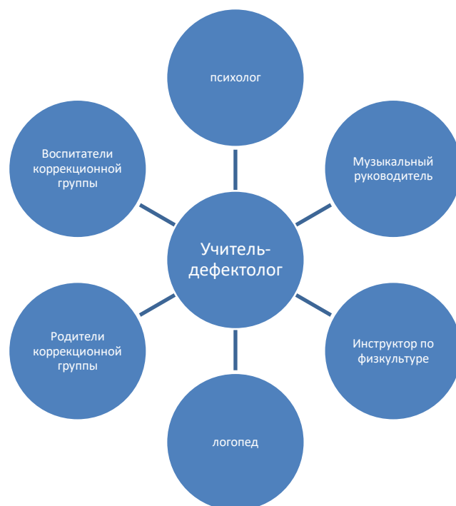
График организации образовательного процесса.